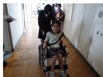
文化祭の一般見学者の多くの方々にも体験してもらえた。