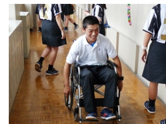
自走がいかに大変かも体験してもらいました。