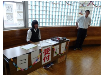
当番制で受付を担当