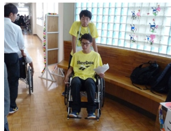
模擬店等の合間に体験する生徒も多かった。