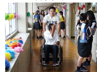
人混みの中を通るのは思った以上に大変であることを体験した。