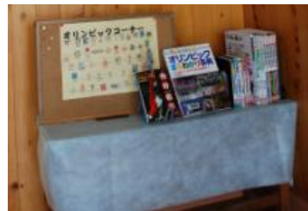
【関係書籍の設置の様子】