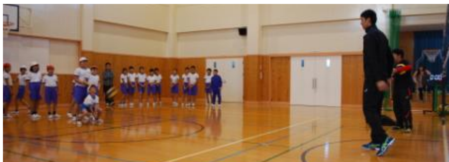
【レシーブ体験の様子】