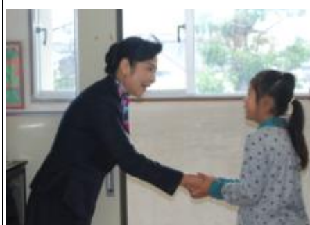
【握手の仕方を学んだ後の児童の様子】

加という方法もある。直接、オリンピックに参加しなくても、道を尋ねられたり、名所の案内を頼まれたりするかもしれない。あいさつの仕方、礼の仕方、握手の仕方、心のこもった対応の仕方などを、具体例を交えて話していただいた。