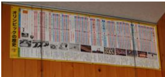
【オリンピックの歴史年表掲示の様子】