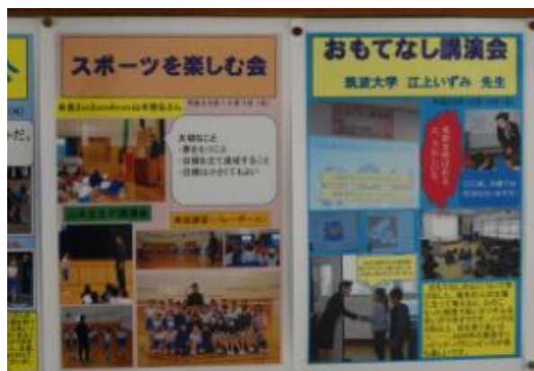
【二つの実践を紹介したパネル】

○事後、横武小の思い出アルバム(掲示板)にオリパラ関係のこれら2例の実践をパネル化して掲示し、「スポーツを楽しむ心」や「おもてなしの精神」をいつまでも忘れないように工夫している。