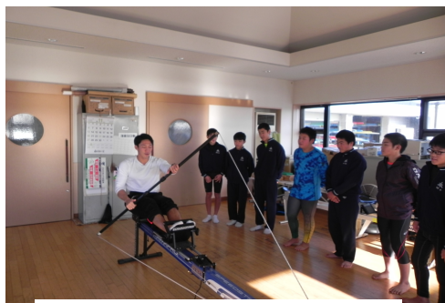
< 漕ぎ方の指導 >