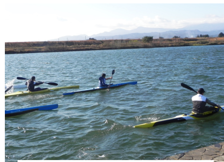
< 水上での漕ぎ方の指導 >