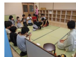
【茶道体験教室の様子】

本校職員を講師に活動を行った。教室に畳を敷き、お辞儀の仕方や茶の作法とその意味を学んだ。その後、実際に湯を沸かし、茶を点て、お茶やお菓子をいただいた。現在の子供たちは、畳がない家庭も多く、慣れない正座に足がしびれている様子も見られたが、とても落ち着いた時間を過ごすことができていた。