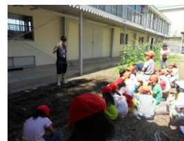
【JAの方と種まきをしている様子】

JAの方を講師に、学校の畑で大豆の栽培活動を行った。子供たちは、進んで水やりをしたり、雑草を抜いたりするなど、意欲的に取り組む姿が見られた。