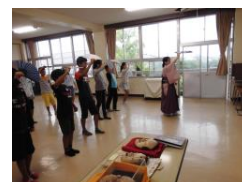
【能体験教室の様子】

6年生は社会科で学習した能や茶道を実際に体験することで、日本の伝統文化について理解を深め、我が国に誇りをもたせるとともに、日本人としての自覚を高めることをねらいとし、活動を進めた。