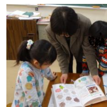
【図書資料を活用した調べ学習】

大豆を収穫した後、図書資料やインターネットを活用して世界の大豆料理を調べた。子供たちは、ふだんあまり目にしない世界地図に興味をもち、意欲的に調べ学習を行った。調べ学習を行った後、グループ毎に世界の大豆料理発表会を行った。「アメリカ・ブラジル・タイ・韓国」等の国々で食されている料理を紹介し合うことで、世界には様々な国があることを知る機会となった。