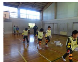
【重りを装着して歩行体験】

加美町社会福祉協議会の方を講師に、車イスの使い方の説明を受け、補助の仕方を学んだ。また、白杖体験を通して目の不自由な方の苦労や補助の仕方を学んだ。どの活動も真剣に取り組む姿が見られた。