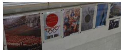
東京オリンピックの様子