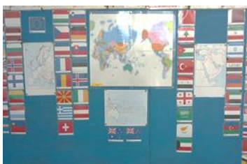
世界の国々について