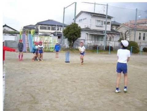
小学校でもクリケットを実施 (用具は、日本クリケット協会より寄贈)