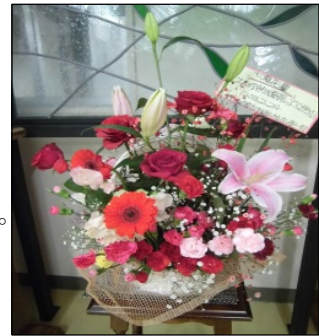
100本の花のアレンジメント