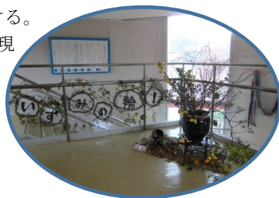
できあがったオブジェ