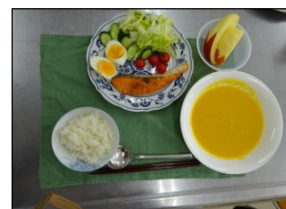
人参と鮭のおもてなし料理