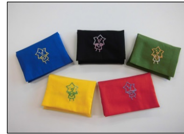
五色のポケットティッシュ入れ