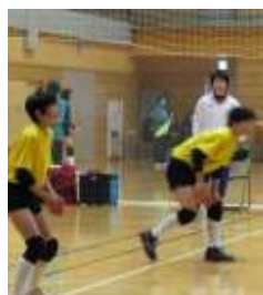
(練習時における動きの支援)