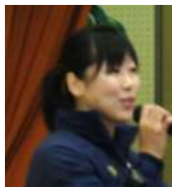
(講演する小室選手)