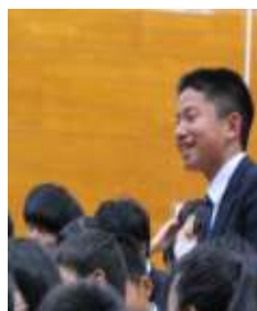
(講演後、質問する生徒)

みなさんは今、将来に種をまき、 育てている時期ですね。(中略) 今を一生懸命生き、なんでも自分 の栄養にして自分の中の花を育て ていってください。