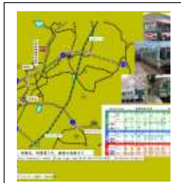
(タウンマップその1)