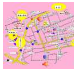
(タウンマップその2)