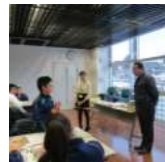
(役場での放課後学習会)