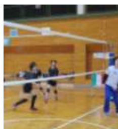
(練習ゲームの支援)