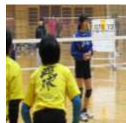
(高校遠征への協力)