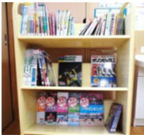
【中央廊下、小学校図書館、中学校図書館の様子】