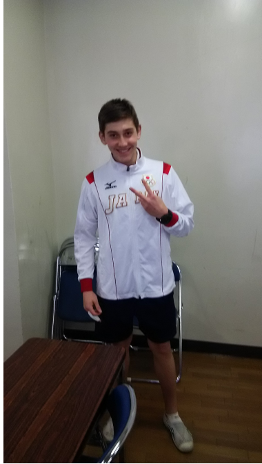
オリンピックのジャージ