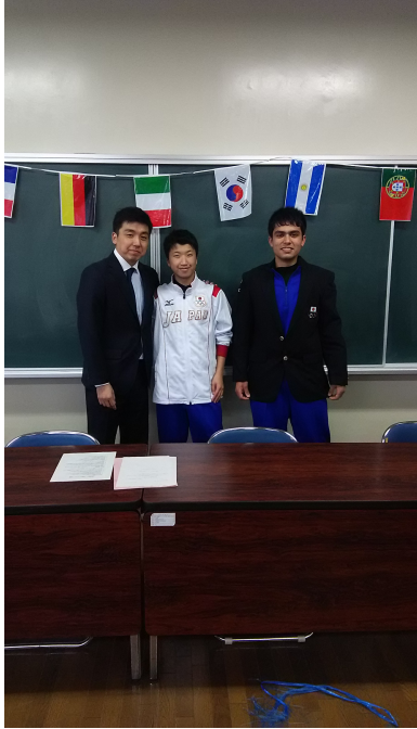
西田選手と記念撮影