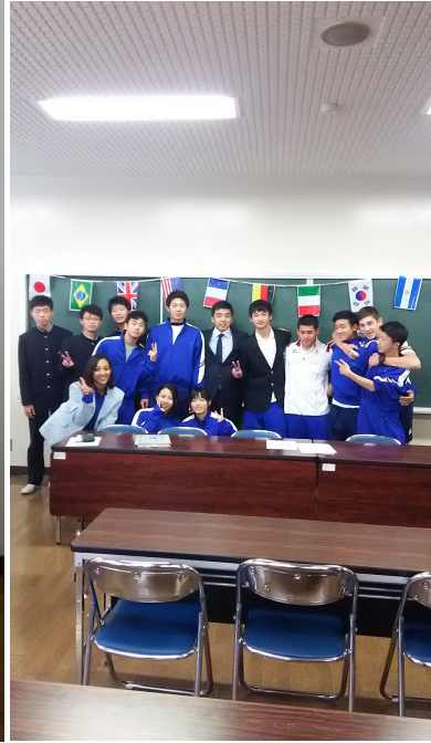
多国籍生徒との記念撮影