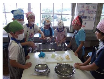
お米をとぎながら、タイと日本のお米の違いについて話している5年生

◇事後学習：各学年が、実際にタイの子どもたちと授業等で交流したことを振り返る時間を設定した。言葉や文化の違いを実感するとともに、国が違って互いを理解しようとする気持ちやその気持ちが伝わったときの喜びを表現する子どもが多く見受けられた。北九州市はタイのオリンピック・パラリンピック選手のホストタウンである。本取組での出会いを大切にすること、2020年に向けて一人一人ができることを実行に移すことがオリンピック・パラリンピックの成功につながることを確認した。