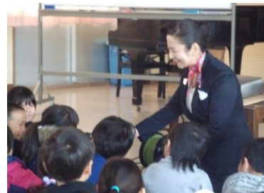
江上先生におもてなしの心を教えていただいた2年生

東京オリンピック・パラリンピックが開催される2020年には5年生として長尾小の要となる2年生を対象に、筑波大学客員教授：江上いずみ先生を講師としてお招きし、「おもてなし講座」を実施した。「おもてなし」は、相手に喜んでもらうことをして差し上げること。おもてなしと思いやりの心をもって人と接すると相手も自分も周りの人もいい気持ちになれることを教えていただいた。