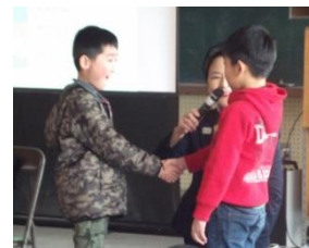
握手は右手で相手の目を見てギュッと握る

とくに、「挨拶は相手に何と言っているかが分かるように顔を上げたまま言葉を発し、その後、頭を下げること」については、教えていただいてすぐに行動に移し、気持ちのよい挨拶をする姿が見受けられるようになった。