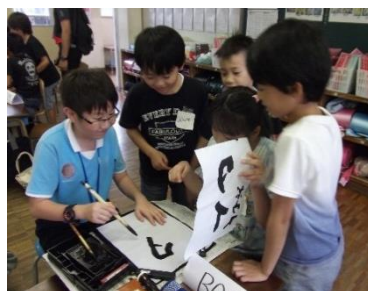
筆のもち方や筆遣いを教える3年生

3年生は、事前に一つ一つの道具の名前をローマ字で書いたカードを作成し、それを示しながら道具の使い方を身振り手振りで説明していた。3年生は、改めて筆の使い方や筆遣いを確認しながら、タイの子どもたちに習字を教えていた。