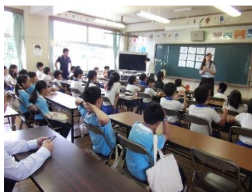
ALT を中心に英語による自己紹介 (外国語活動)