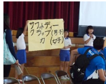
歓迎集会でタイ語を披露している様子