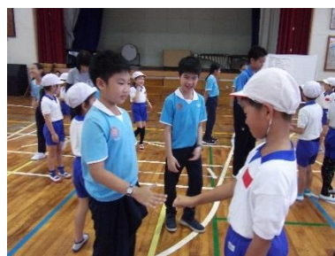
出会いのゲームをする2年生

音楽では、タイを代表する動物であるゾウについて学習するとともに、日本語とタイ語で「そうさん」の歌を練習して、タイの子どもたちと合唱した。