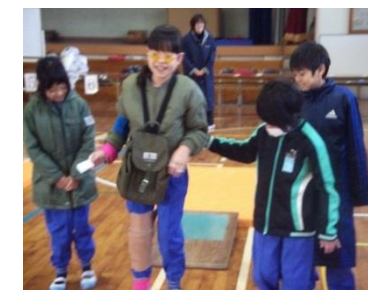
身体が思うように動かせない体験をする4年生

「アイマスク体験」。耳栓や視野が狭くなるメガネをかけたり、関節が自由に動かなくなるようなサポーターや手首・足首・お腹におもりを装着したりする「高齢者体験」。それぞれの体験により、障害をもった方やお年寄りが生活する上での苦労や工夫を知ることができた。また、体験を通して感じたことを基に障害をもった方たちと共生する社会について、さらに来年度の取組につなげる。