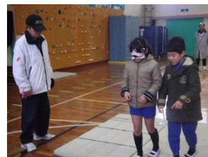
2人組でのアイマスク体験

5年生の車椅子バスケットボール大会への出場を受けて、障害のある人や高齢者に対する理解と認識を深めるために、4年生が「福祉体験学習」に取り組んだ。アイマスクを付けて目が見えない状態をつくり、不安定なマット上を歩いたり、狭い通路を通ったりする