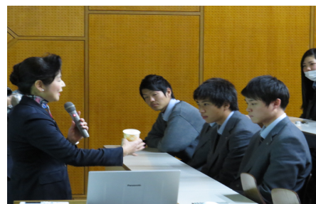
飲み物の受け渡し