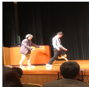
義足を付け実際に歩いてみる