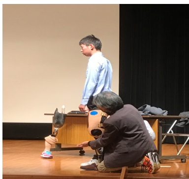
本校生徒に義足をつける