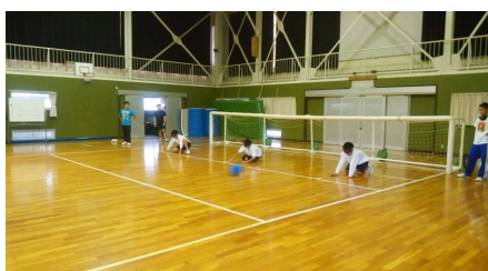
目隠しをして、指示だけでゴールを守る