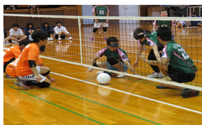
障害者トップアスリート同士のエキシビジョンマッチ