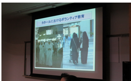
国によっておもてなしが異なる