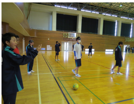
ボールの場所を指示する様子