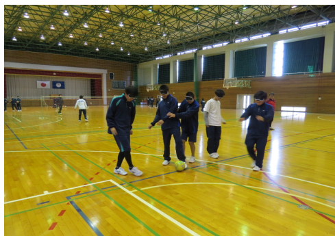
ボールの場所にたどり着けない様子