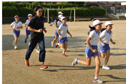
(小鴨選手と一緒に試走)