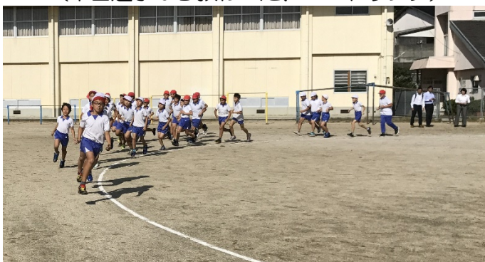
（小鴨選手から教わった、持久走）