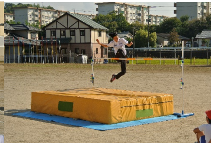
(高跳びの模範試技)