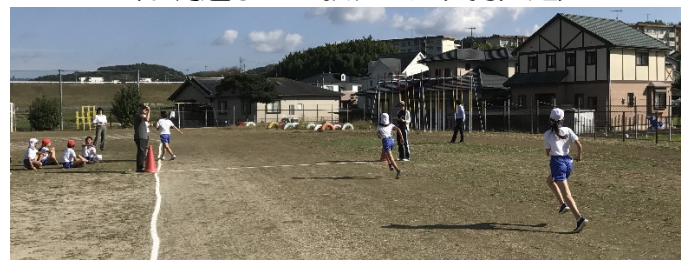
（最後まであきらめずに走り抜いた児童達）