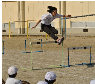
(ハードルの模範試技)