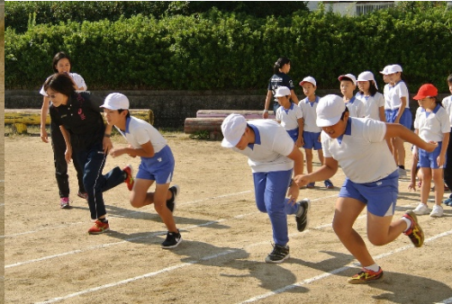
(小鴨選手も一緒にスタート練習)