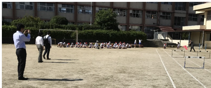
（県教育委員会から3名の指導主事が視察される中、競技開始）