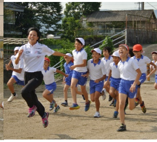
(ウォーミングアップ)