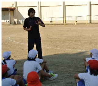
(長距離走の走り方指導)