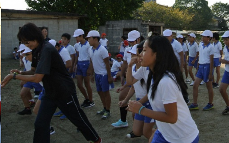
(小鴨選手と一緒に試走)