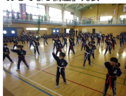
「1・2年生による空手発表」