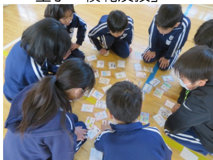
「手作りオリパラかるた大会」