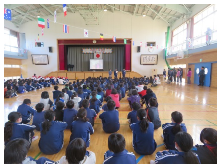
「おもてなし講座」発表