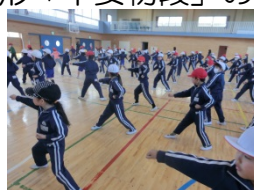
形「平安初段」の練習