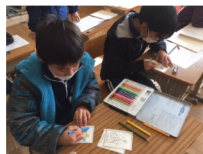
「インターネットによる調べ学習」 「3年生による取り札の色塗り」