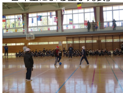
「ブラインドサッカー」の競技