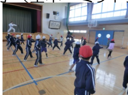
基本の突き方練習