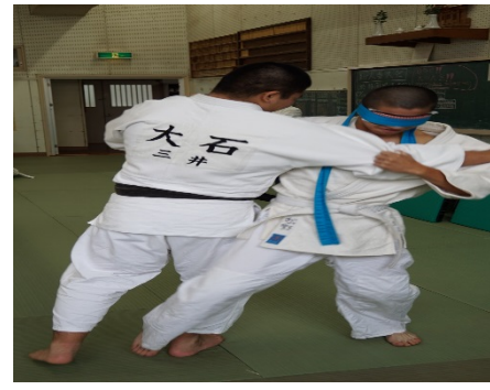
オリンピックルールでの柔道