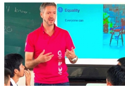
オリンピック・パラリンピックについての英語で説明を受ける