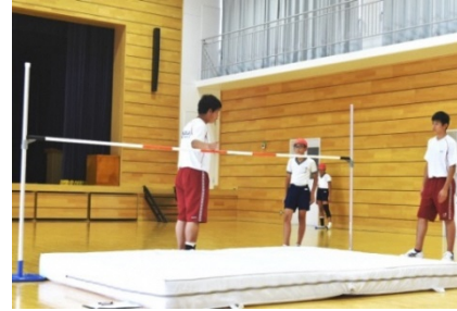
小学校に行き、陸上競技について指導する高校生