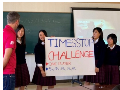
ワークショップ もし(what if)目が見えなかったら 競技を考え、発表する