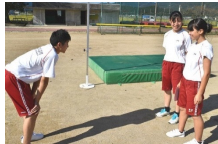
南丹高校のグラウンドで、小学生への指導方法を研究