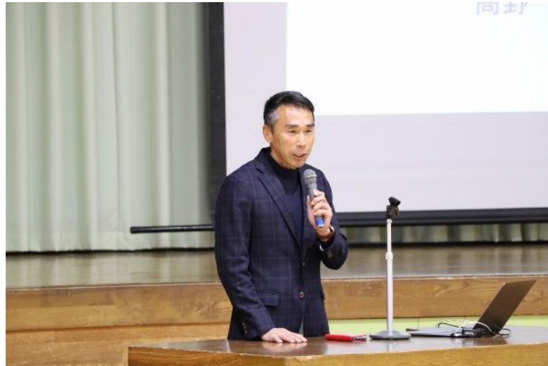
陸上 400mでオリンピック 3 大会出場の高野進先生

お招きし、5・6年生を対象にご講演をいただいた。講演では、4年生の国語の教科書にも掲載されている「動いて、考えて、また動く」というテーマの話や、速く走るためのフォームづくりについて実技指導を受けた。