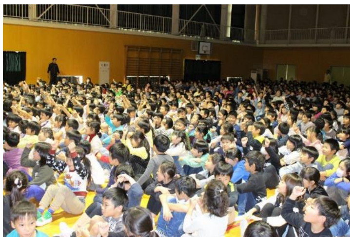
オリンピックについてのクイズで盛り上がる子どもたち