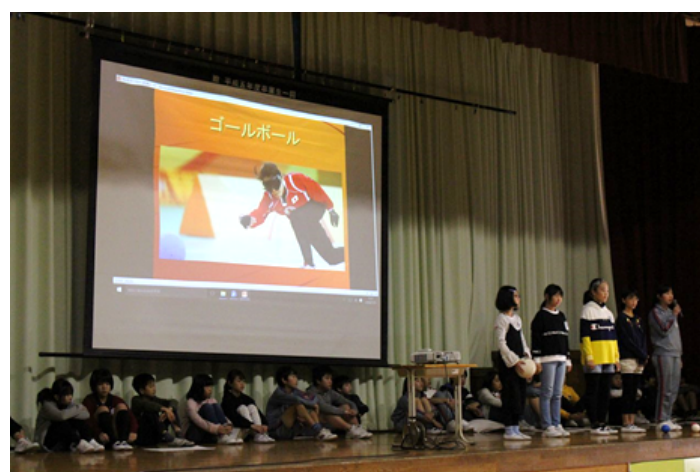
パラリンピックの種目も紹介