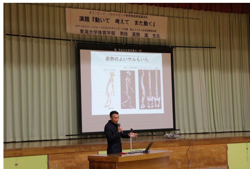
子どものころの体づくりの大切さについて講義