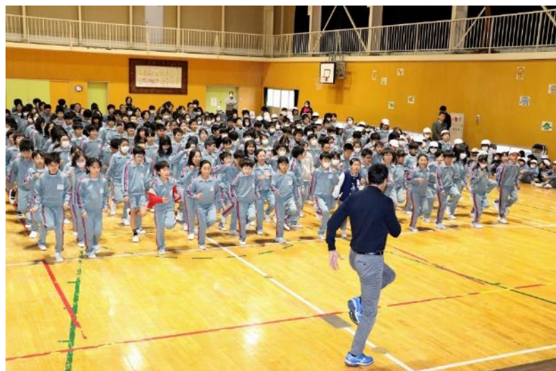
速く走るフォーム「4」の字になるように