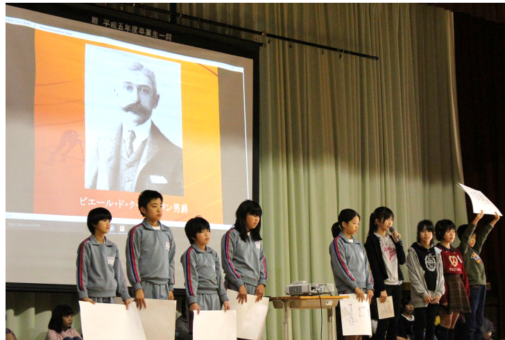
近代オリンピックの創始者クーベルタン男爵について