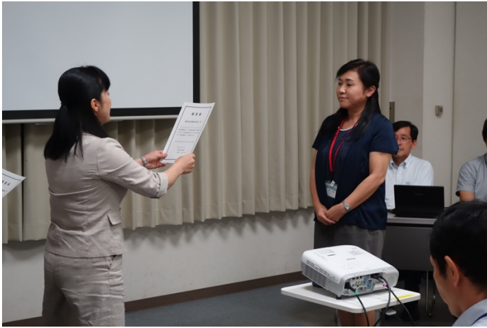
写真 3. 認定証の授与の様子