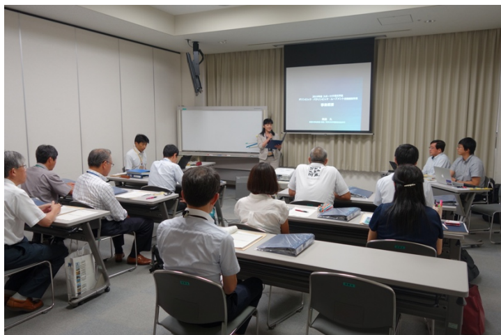
写真 1. 会場の様子

各推進校より、本年度の事業計画が発表された。また、筑波大学体育系助教大林氏より、アンケート調査協力、オリンピック・パラリンピアン派遣プロジェクト、「おもてなし講座」について紹介した。