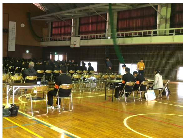
写真 4. 高校生記者の様子