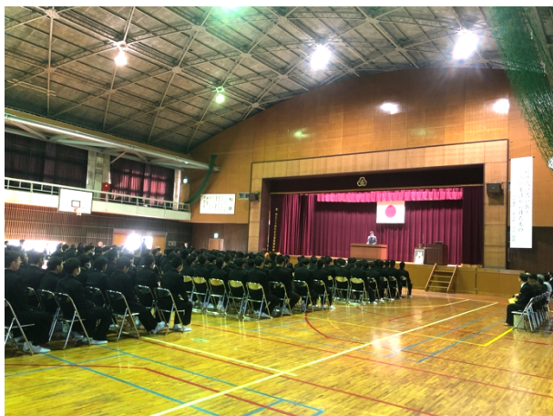
写真 1. 会場の様子

https://www.ehime-np.co.jp/special/egao_sports/reporter_top/