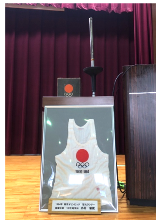
写真 2. 聖火リレーのユニフォーム およびトーチ