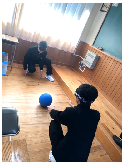
写真 7. ゴールボール体験の様子