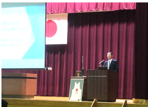
写真 3. 講演の様子