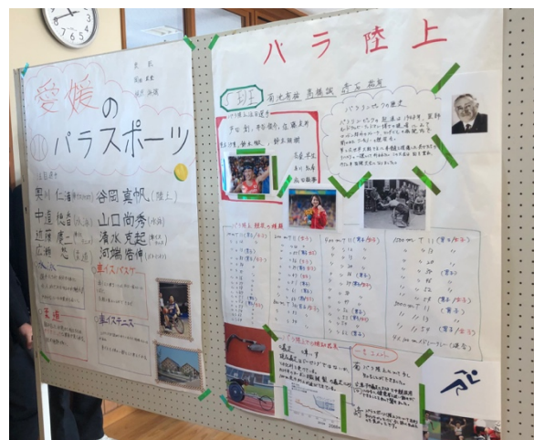
写真 6. パラスポーツブースの展示②