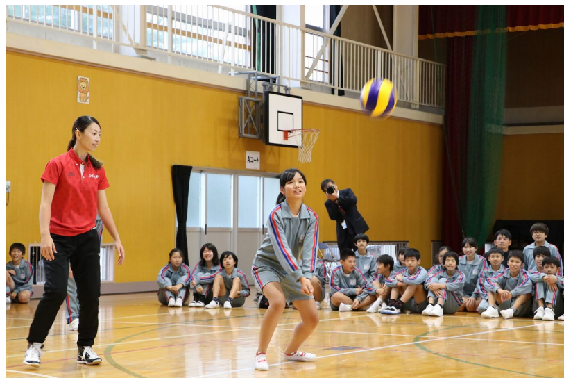
子どもたちがレシーブ！