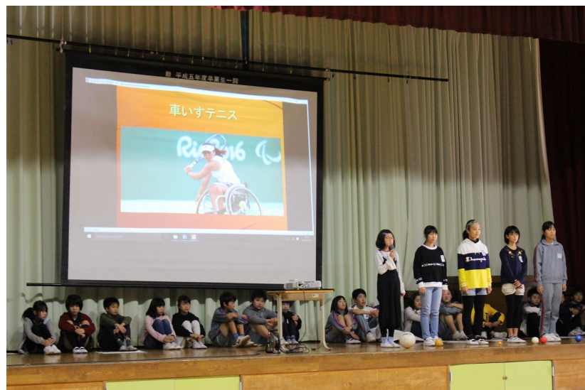
パラリンピック種目についても紹介