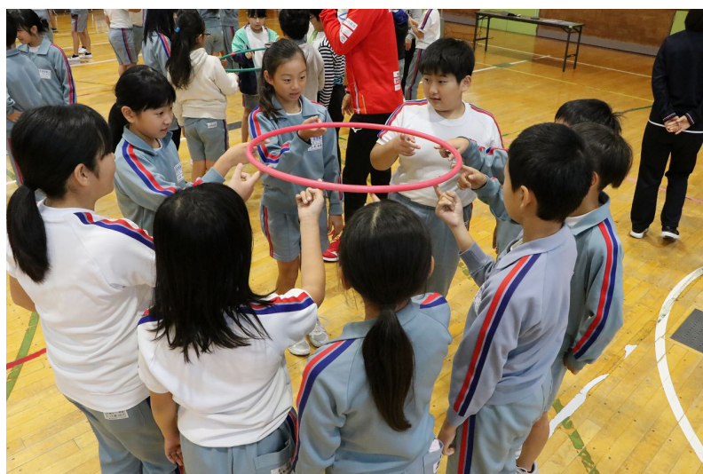
フラフープダウンゲームでチームワークの大切さを学ぶ