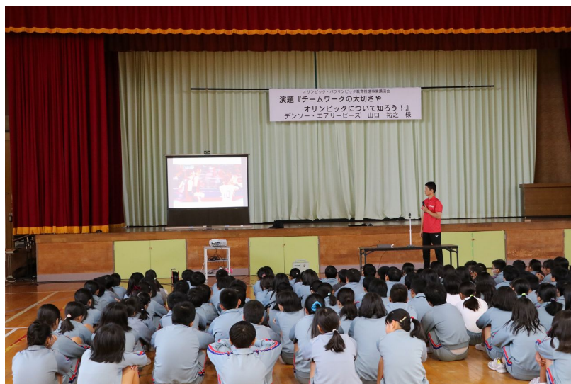
ロンドンオリンピックの活躍について映像をもとに紹介