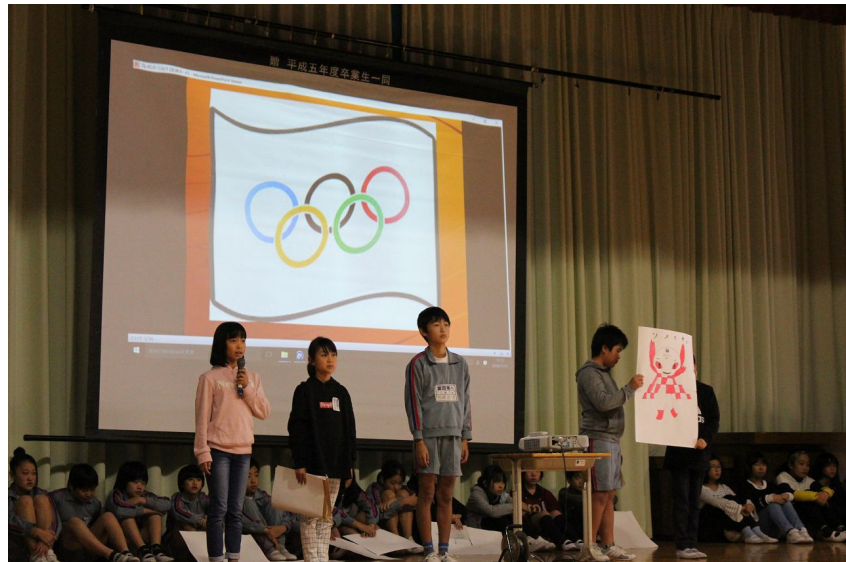
クイズ形式でオリンピックの由来や種目を紹介

○内 容：全校集会において「オリンピック・パラリンピック とは何だろう」のテーマで、児童会集会委員会が発表 を行った。