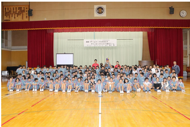
みんなで記念撮影