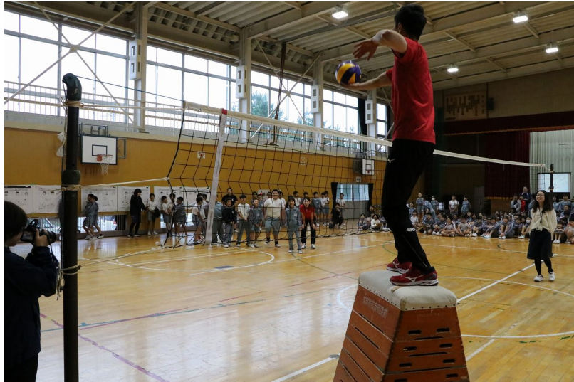
山口さんが全力で打つスパイクを