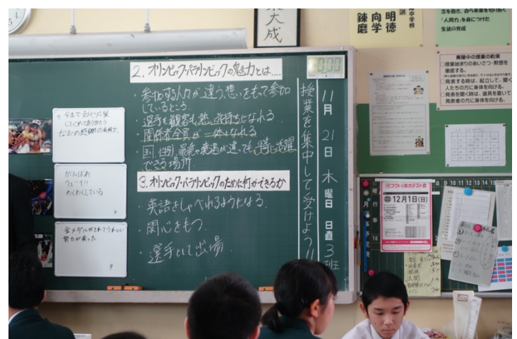
写真 8. 板書②