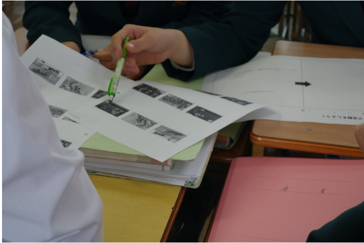
写真 5. グループワークの様子③