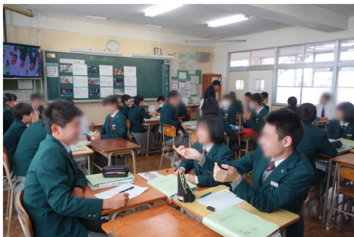
写真 3. グループワークの様子①