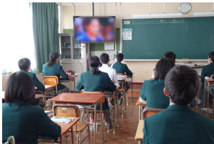
写真 2. VTR 視聴の様子