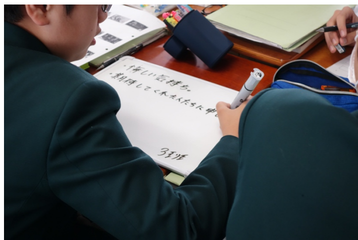
写真 4. グループワークの様子②