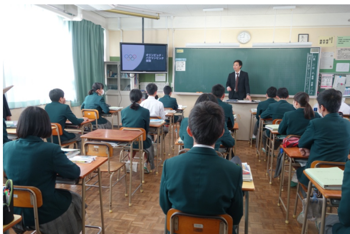
写真 1. 導入の様子