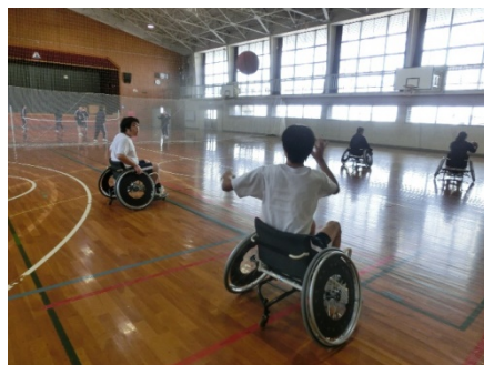
車いすバスケットボールの様子