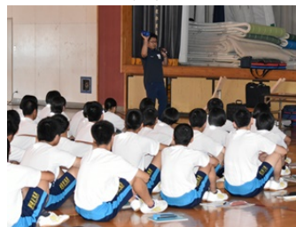
生徒たちが熱心に 講演に聴き入る様子