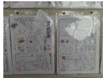
総合：世界の国々について調べよう