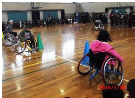
車いすリレーをする児童