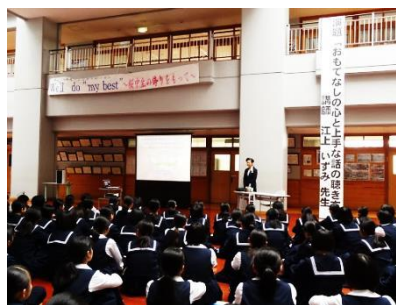
<おもてなし講座の様子>