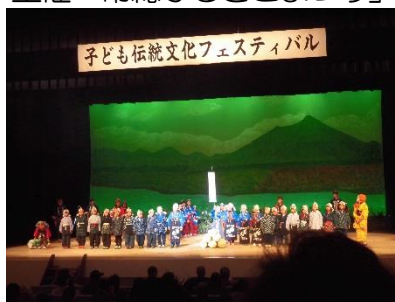
県主催「子ども伝統文化フェスティバル」 新聞報道