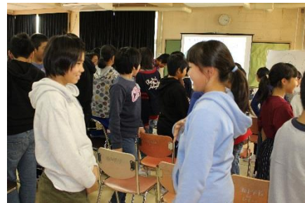
目と目を合わせて挨拶の練習