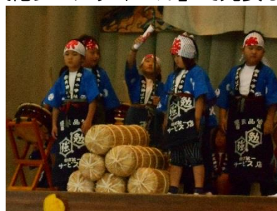
学校「三世代ふれあいの集い」