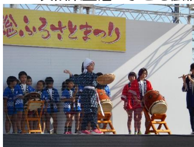
市主催「常総ふるさとまつり」