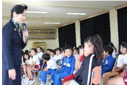
低学年にも分かりやすい授業