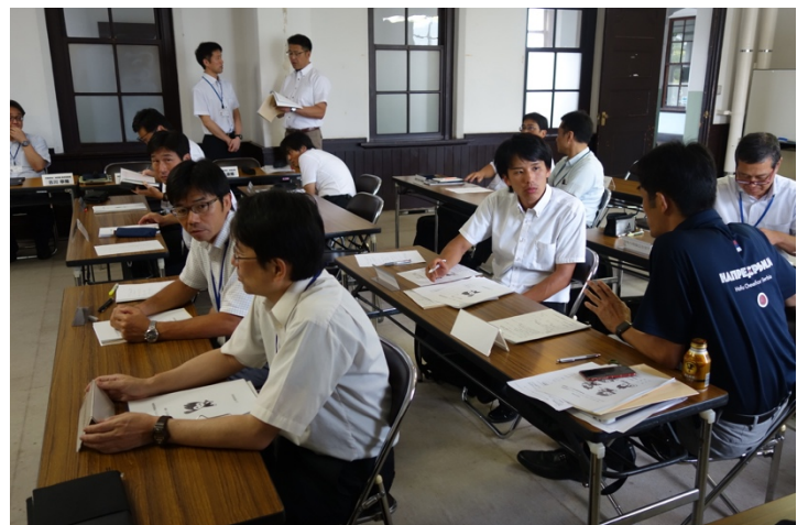
写真 6. 打ち合わせの様子