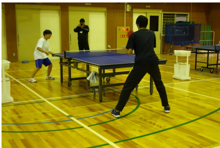
写真3. ゲーム練習の様子②