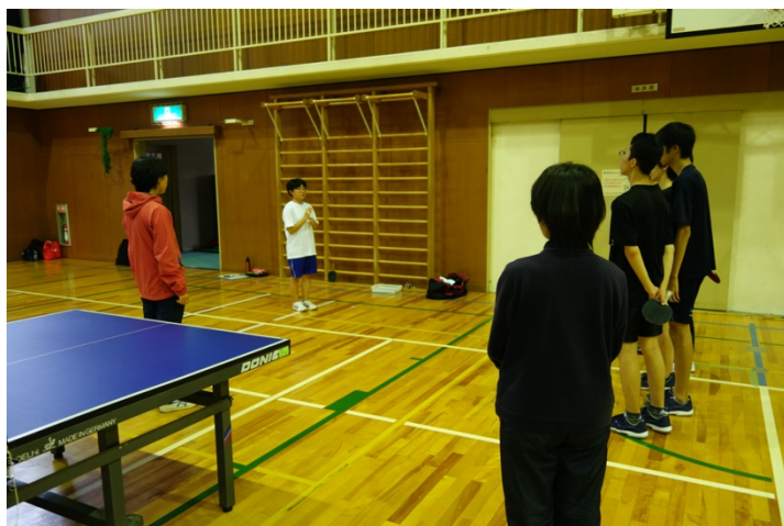
写真4. 感想の共有の様子