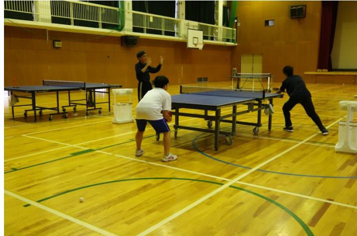
写真2. ゲーム練習の様子①