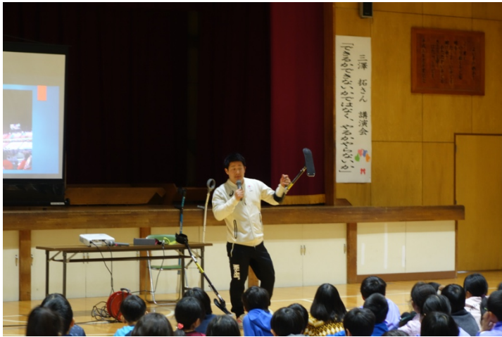
写真 3. 用具の説明