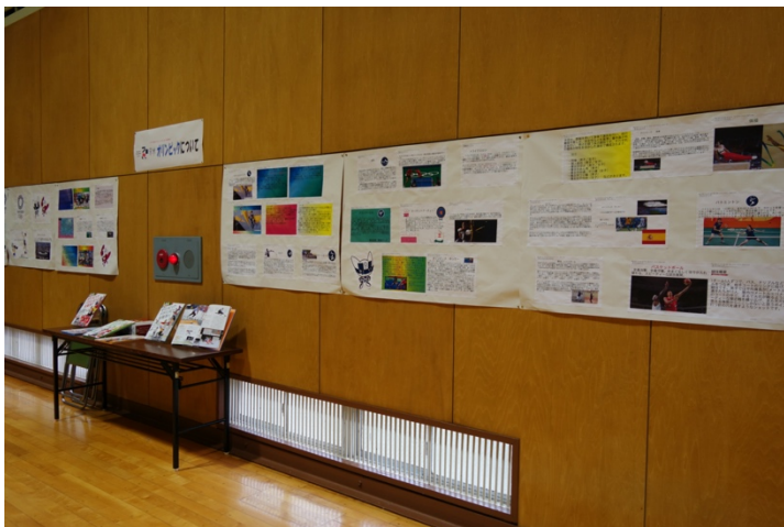
写真 5. 調べ学習の内容の展示①