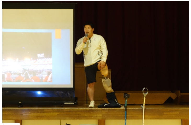
写真 4. 義足の説明