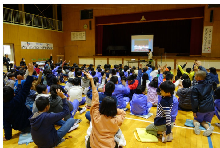
写真2. 講演会の様子②