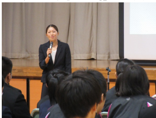
【北京オリンピック出場の千葉 麻美氏】