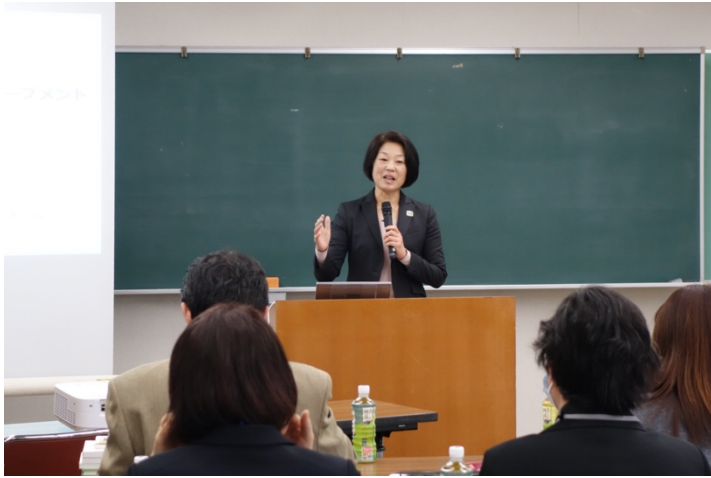
写真 3. 実践事例報告の様子