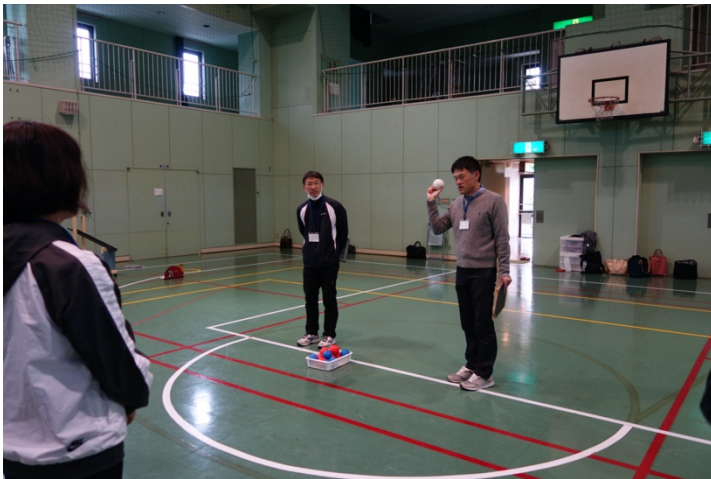
写真 5. ボッチャ講習の様子①