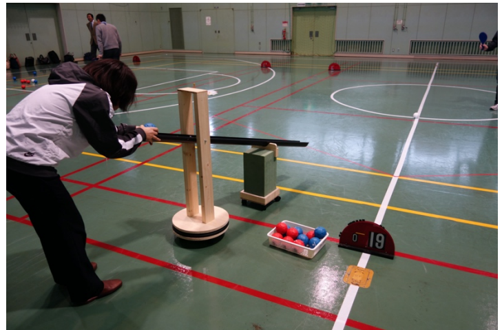
写真 6. ボッチャ講習の様子②