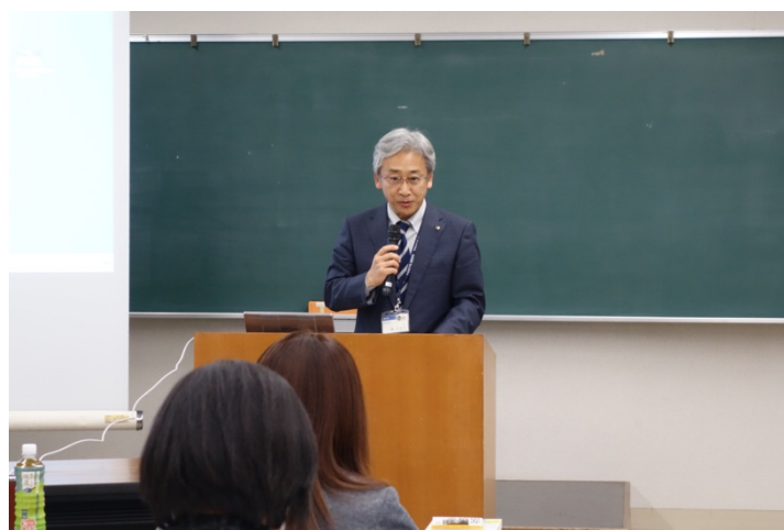
写真2. 開会挨拶の様子