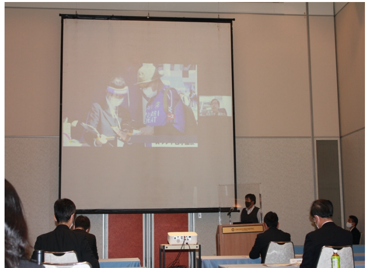
写真2. 実践報告の様子