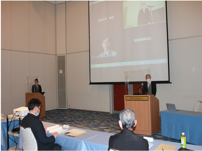
写真1. 開会挨拶の様子