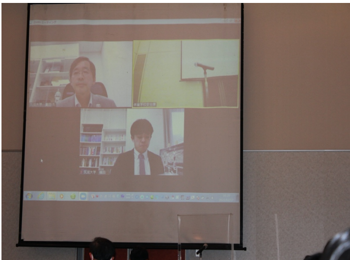
写真3. オンライン参加の様子